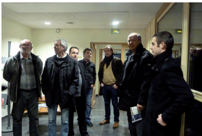
Economie des seniors : «grappes» d'entreprises

Cela concerne 15 à 20 entreprises sur le Département en 2013.