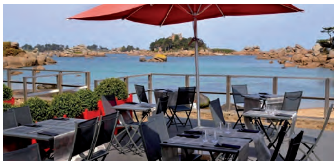
Hôtel Castel Beau Site à Perros-Guirec

Une convention de partenariat a été proposée aux clubs hôteliers permettant ainsi d'arrêter un programme de travail pour 2014.