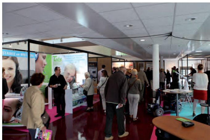
L'espace économie des seniors à la Foire expo de Saint-Brieuc

En 2013, une mission a été conduite par AFPA Transition auprès de 10 entreprises repérées par rapport à leurs difficultés à recruter un commercial. L'hypothèse initiale du groupe de travail, auquel a participé CAD, était la possibilité d'organiser une rencontre entre offreurs d'emplois et demandeurs d'emploi seniors qualifiés selon les compétences demandées par les entreprises. A l'issue de cette étude, en avril 2013, le groupe de travail a conclu qu'il n'avait pas suffisamment d'éléments favorables pour organiser un tel évènement.