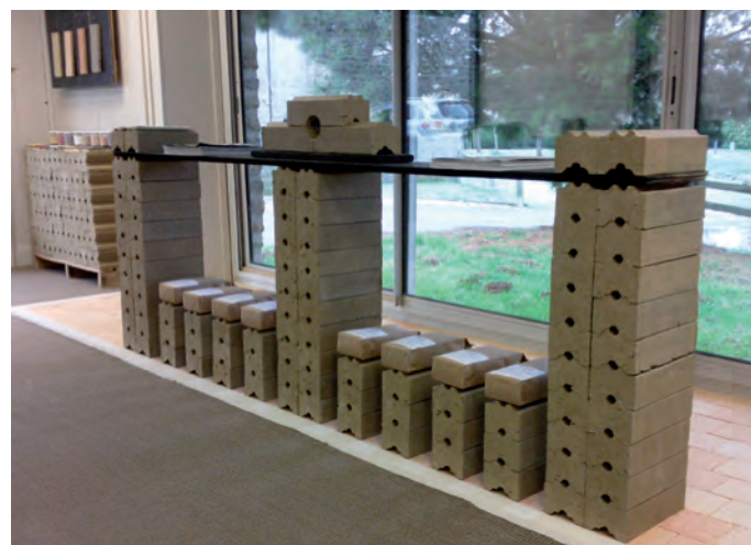
Société Josse France, présentation de l'Argibrique

Les 19 et 20 juin, un autre atelier innovation s'est déroulé chez JOSSE France. Il s'agissait du lancement de l'Argibrique, une brique de cloisonnement à inertie thermique, exclusivement constituée d'argile brute et classée dans les familles des MEP (matériau à énergie passive), Argibrique fait office de climatiseur naturel. La présentation de l'Argibrique a été accompagnée d'une rétrospective des réalisations de carrelages peints à la main de la maison Josse, ainsi que la visite de l'usine de fabrication située à Plancoët.