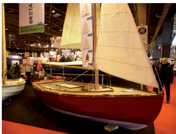
Salon Nautic : stand des Côtes d'Armor

Le stand des Côtes d'Armor est complémentaire des autres stands bretons, Finistère et Morbihan, positionnés à proximité. En 2013, 38 entreprises ont fait l'objet d'un accompagnement.